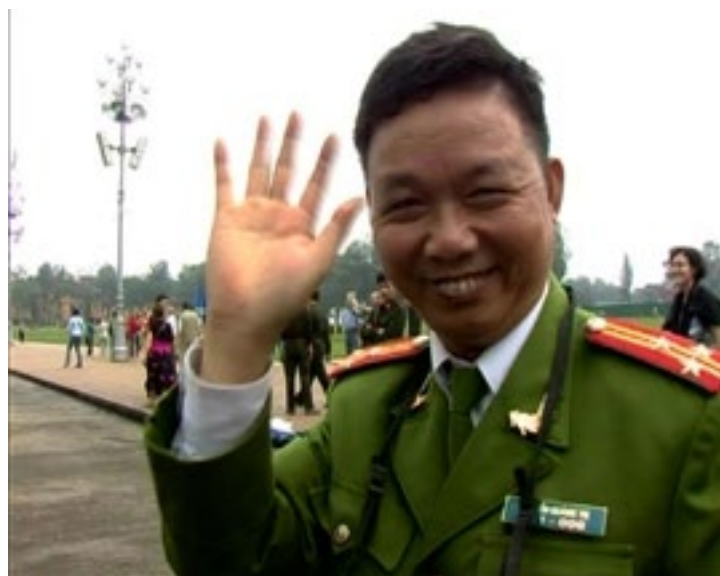
Mohamed Soueid, My Heart Beats Only For Her ; 1995 documentaire, 87 mn