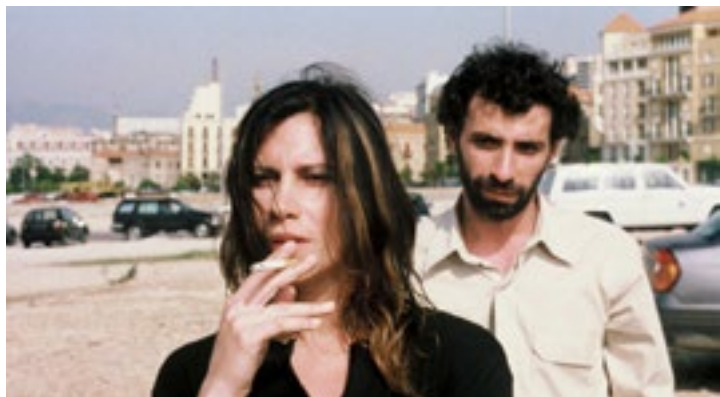
Ghassan Salhab, La Vallée , 2014 Film, 2h 15m